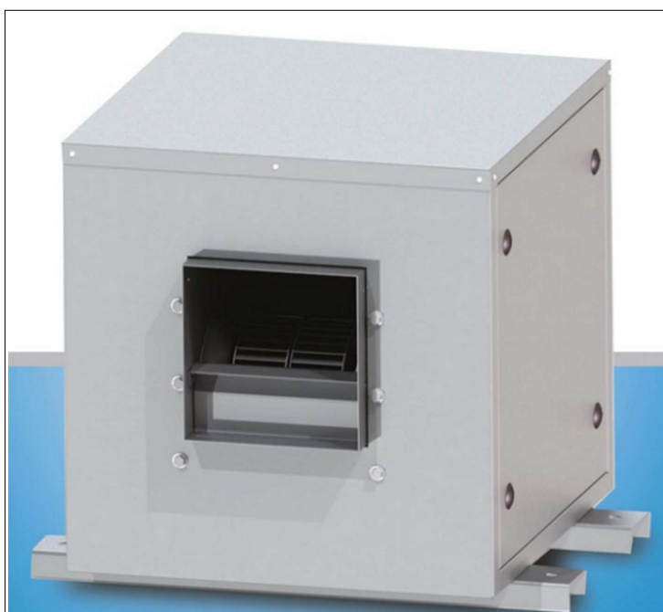
Figura 2. Caixa de ventilação.

A caixa de ventilação deve ser compacta, construída em chapa de aço galvanizado, rotor do ventilador tipo limitd load, com pás curvadas para trás. Acionamento por motor elétrico 220V, potência 0.45 kW, vazão 1.175 m³/h, pressão 30 mmCa, pressão sonora máxima de 61 db(A), diâmetro mínimo do rotor 315 mm. Modelo de referência: Berlinet Luft, GRF230M Sicflux ou similar.