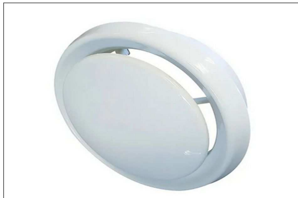
Figura 3. Difusor

Os difusores de ar, fixados no forro dos ambientes, serão circulares, fabricados em ABS com regulagem de vazão, conforme modelo ilustrado na Figura 3.